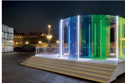
350 Jahre Saint-Gobain, Roadshow weltweit