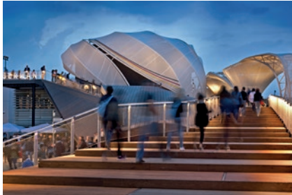
Deutscher Pavillon, Expo Mailand

Für internationale Markenpräsentationen, Roadshows, repräsentative Sponsorenauftritte oder für die nächste Weltausstellung – spektakuläre Architektur fordert uns heraus. Bei der hochwertigen, termingetreuen Umsetzung Ihrer kreativen Ideen zählt es sich aus, dass wir über Know-how aus zahlreichen aussergewöhnlichen Projekten auf der ganzen Welt verfügen.