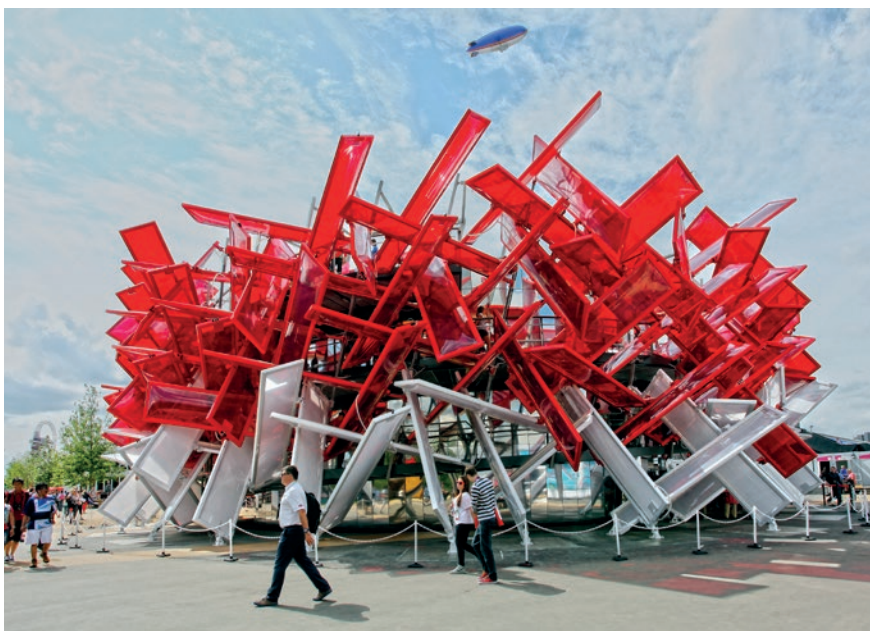
Coca-Cola «Beatbox», Olympische Spiele London