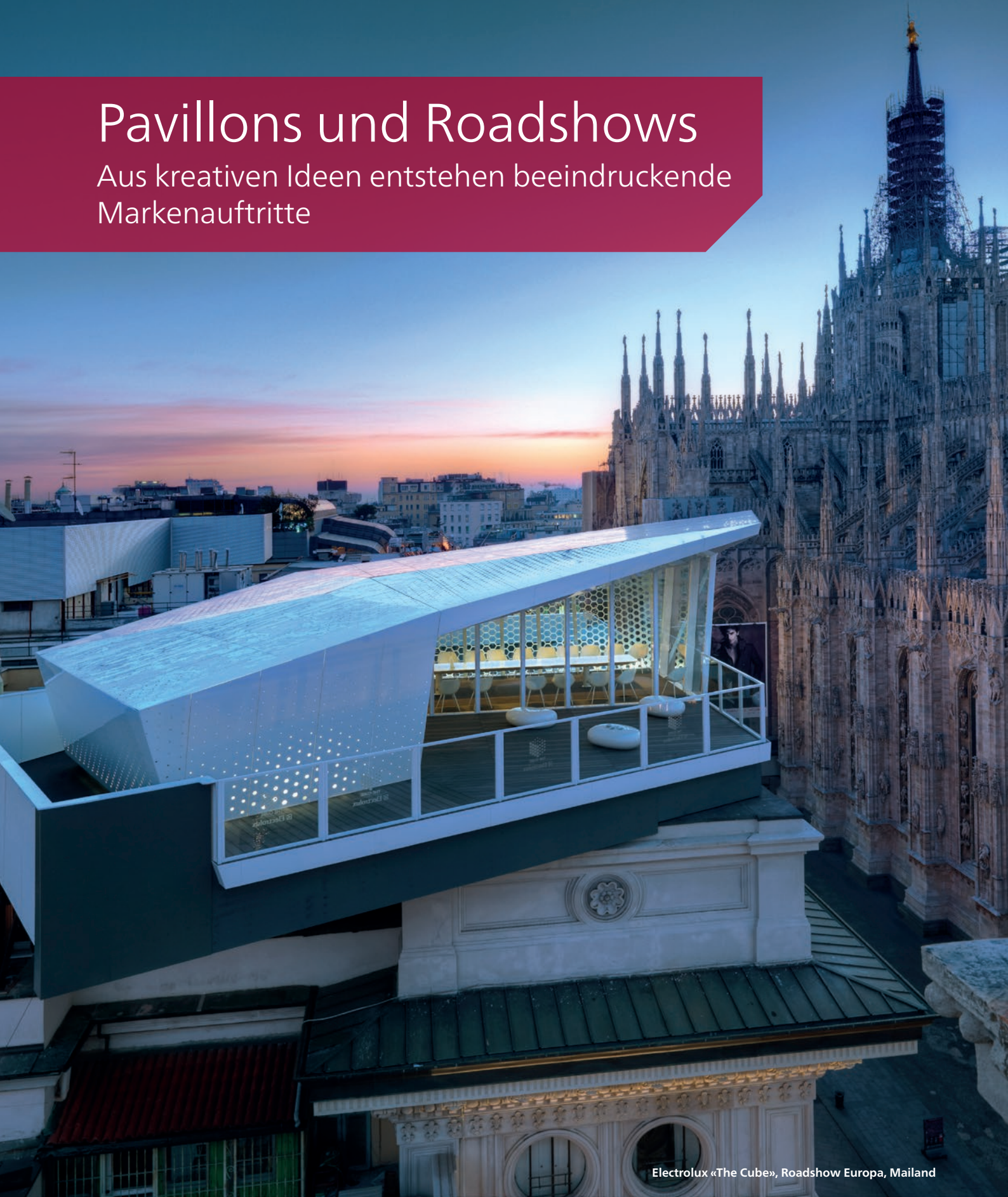
Electrolux «The Cube», Roadshow Europa, Mailand

Aus kreativen Ideen entstehen beeindruckende Markenauftritte