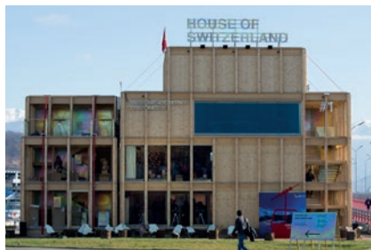
House of Switzerland, Olympische Spiele Sotschi