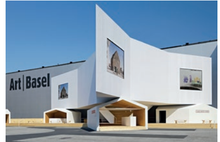
Schaulager Satellite, Art Basel