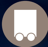
Pavillon «on the Road»