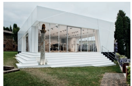
Präsentation Škoda Superb, Siena